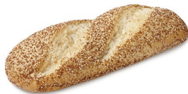
FOTO DEL PRODUCTO COCIDO

De acuerdo a la legislación vigente Este producto NO es de Origen Genéticamente Modificado (GMO), de acuerdo con la normativa Europea EC/2003/1830 y EC/2003/1829.