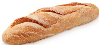
FOTO DEL PRODUCTO COCIDO

De acuerdo a la legislación vigente Este producto NO es de Origen Genéticamente Modificado (GMO), de acuerdo con la normativa Europea EC/2003/1830 y EC/2003/1829.