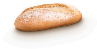
FOTO DEL PRODUCTO COCIDO

De acuerdo a la legislación vigente Este producto NO es de Origen Genéticamente Modificado (GMO), de acuerdo con la normativa Europea EC/2003/1830 y EC/2003/1829.